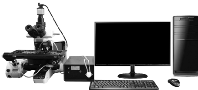
Рис. 2. Комбайн «МЕКОС-Ц2» с загрузкой на 8 стекол, с полным диапазоном разрешений ЦОП, с автоматической настройкой микроскопа, условий съемки, навигации и сканирования для каждого препарата

Выполняют экспорт из МЖЦ в стаю ЛОСКАМ обученной модернизированной версии МАА в качестве модернизации исполнительных анализаторов ИАА стаи комбайнов, осуществ-